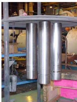
Colunas de matrizes de estampo montadas para processo de nitretação em plasma Ionit ®

Solução para a distorção dimensional: Uso do aço AISI 4340 pré-beneficiado, associado à: Nitretação Deganit ® , Tenifer ® ou Ionit ®